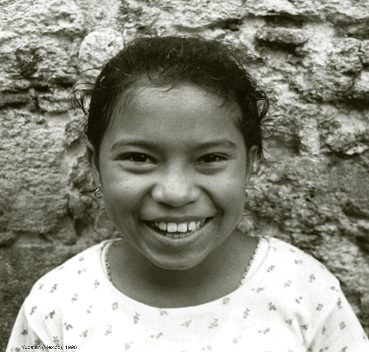
Yucatan (Mexico), 1998

• Lis Buteghis dal mont: a son i distributòrs di sensibilizazion e di promozion culturâl dal finâi, ma a fasin ancje ativitât d'informazion, consum responsabil.